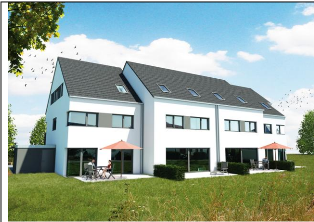
4 Reihenhäuser, 71404 Korb