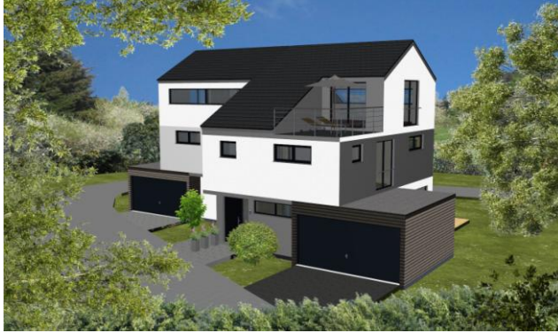
2 Doppelhaushälften, 73650 Rudersberg