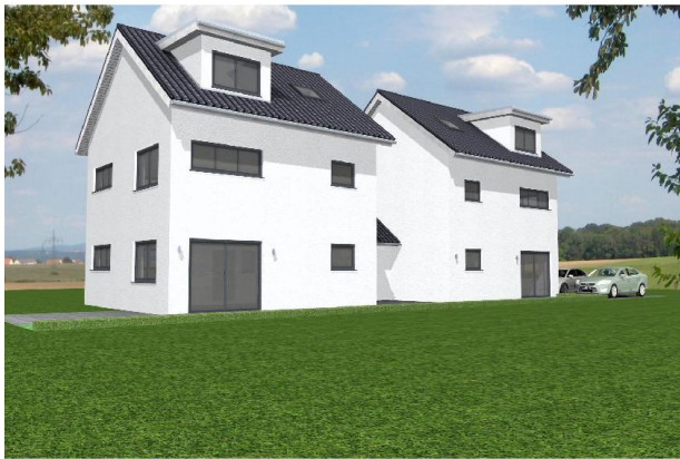
2 Doppelhaushälften, Korb