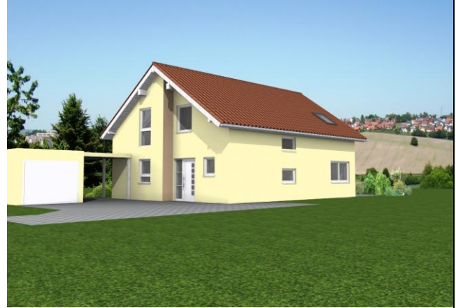
EFH, 73650 Rudersberg