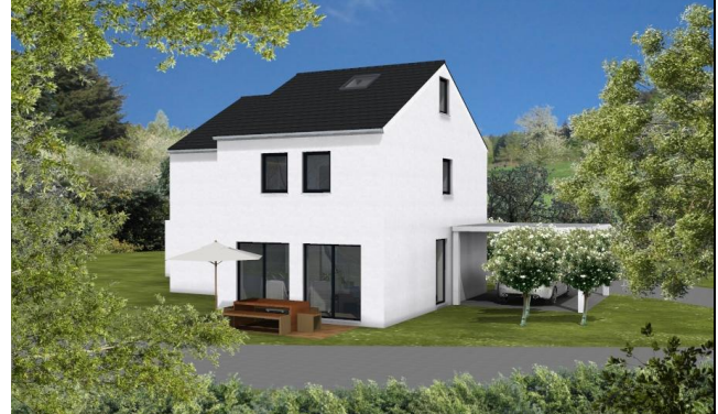
2 Doppelhaushälften, 73650 Rudersberg