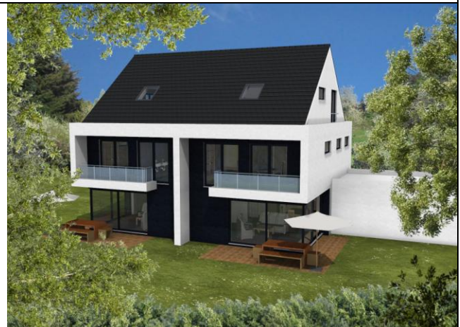
2 DHH, 73655 Plüderhausen