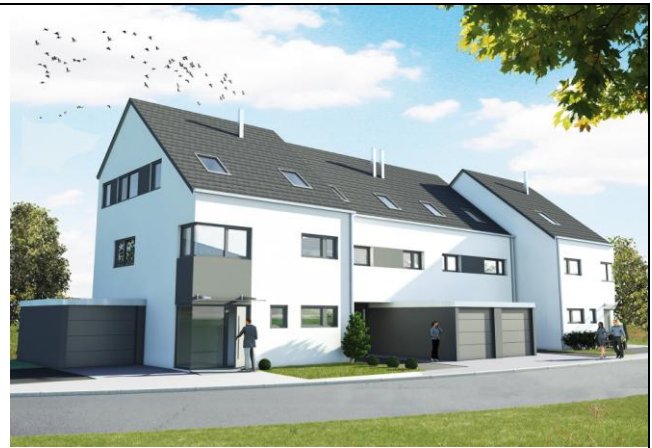
4 Reihenhäuser, 71404 Korb